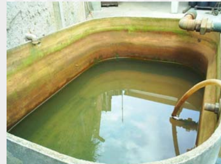
SEPARAÇÃO RESÍDUO DA ÁGUA