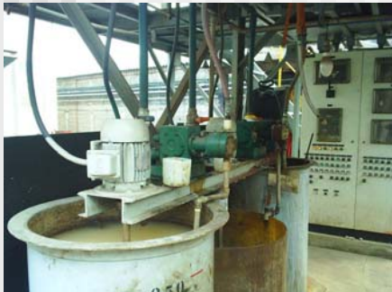
TRATAMENTO COM FLOCULANTE