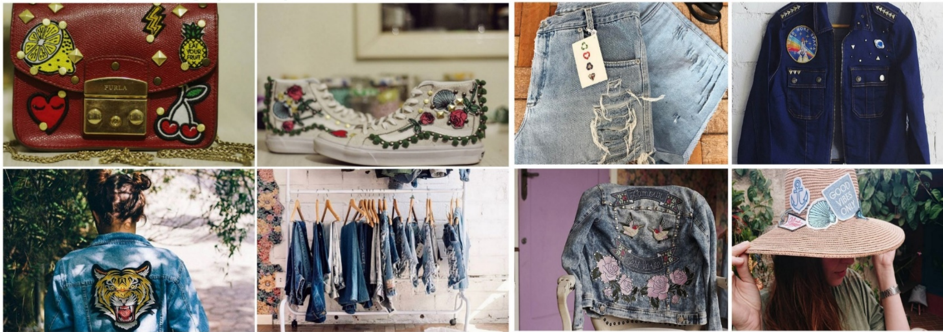
Fig 3: Marca Recollection Lab .